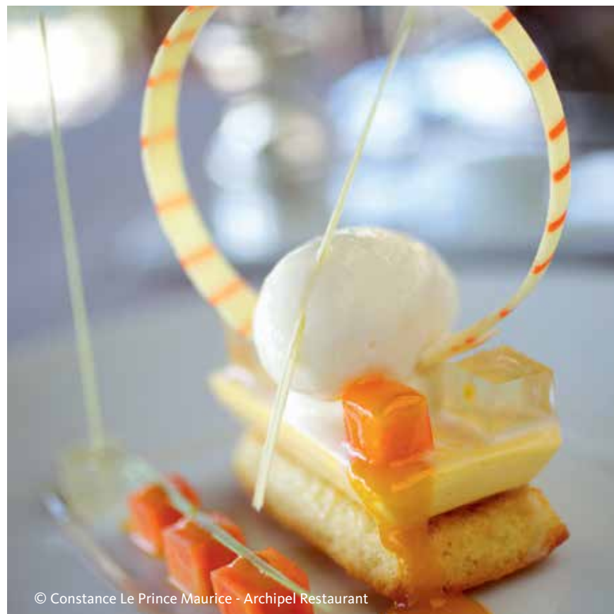
© Constance Le Prince Maurice - Archipel Restaurant